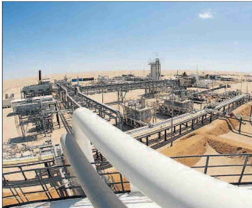
Förderanlage der deutschen Firma Wintershall bei der Oase Jakhira. (28. April 2008)

Themen-Nr.: 719.10 Abo-Nr.: 1077515 Seite: 4 Fläche: 43'188 mm 2