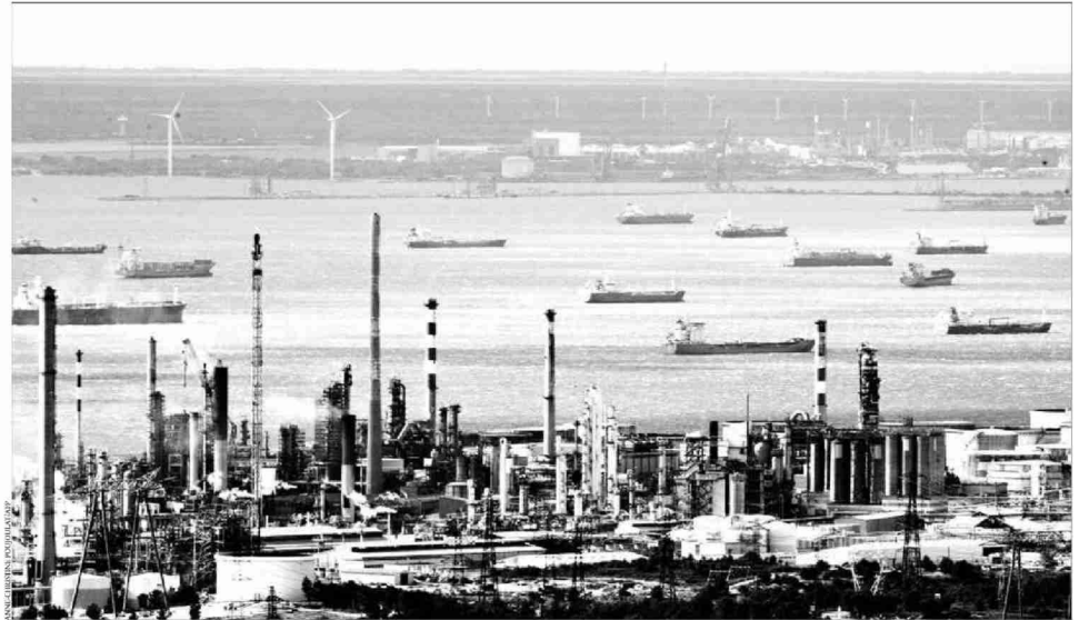
Près des 80 pétroliers attendent de pouvoir décharger. «En 2009, le port représentait 47% des entrées de pétrole brut dans les ports français.» MARKIGARS, 17 OCTOBRE 2010

Le Ministère de l'intérieur a totalisé 560 000 manifestants dans toute la France, soit la plus faible mobilisation depuis la rentrée. De son côté, le syndicat CGT a évalué la mobilisation à 2 millions de personnes, également en baisse. Au plus fort de la mobilisation, le 12 octobre, entre 1,2 million et 3,5 millions de personnes étaient descendues dans la rue. AFP