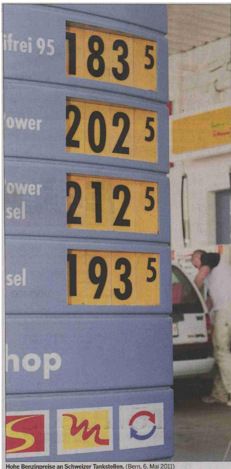
Hohe Benzinpreise an Schweizer Tankstellen. (Bern, 6. Mai 2011)

Themen-Nr.: 719.10 Abo-Nr.: 1077515 Seite: 35 Fläche: 64'228 mm 2