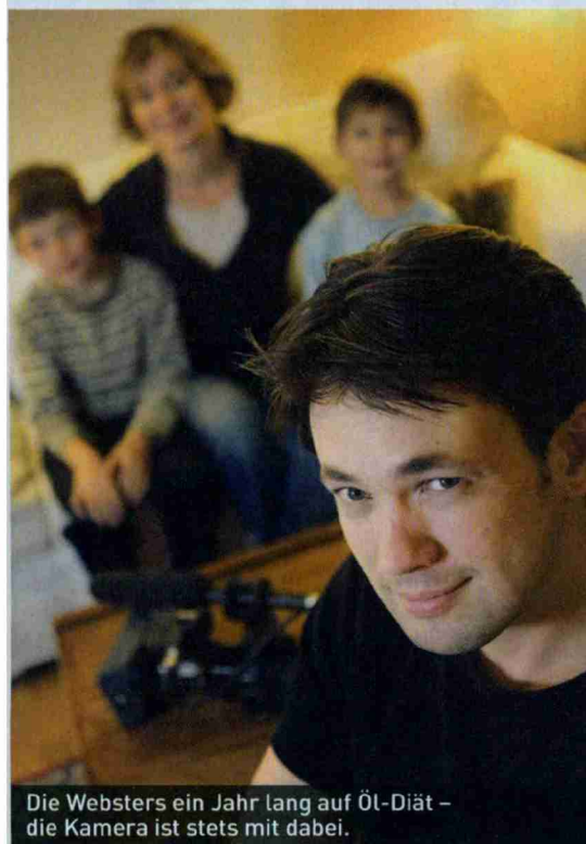
Die Websters ein Jahr lang auf Öl-Diät – die Kamera ist stets mit dabei.