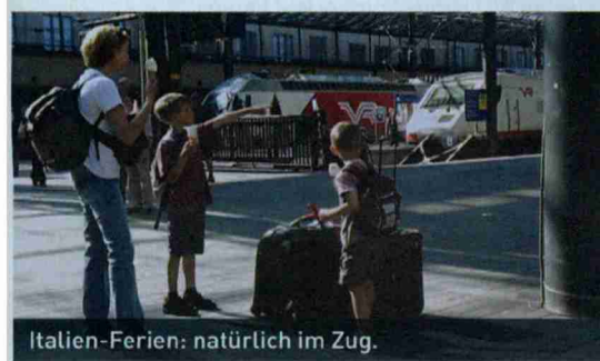
Italien-Ferien: natürlich im Zug.