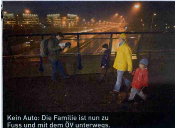
Kein Auto: Die Familie ist nun zu Fuss und mit dem ÖV unterwegs.

Themen-Nr.: 719.10 Abo-Nr.: 1077515 Seite: 12 Fläche: 145'342 mm 2