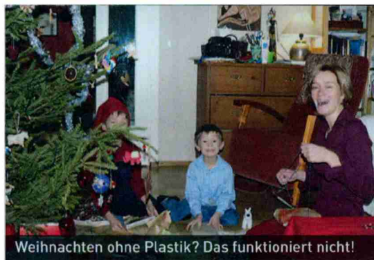
Weihnachten ohne Plastik? Das funktioniert nicht!