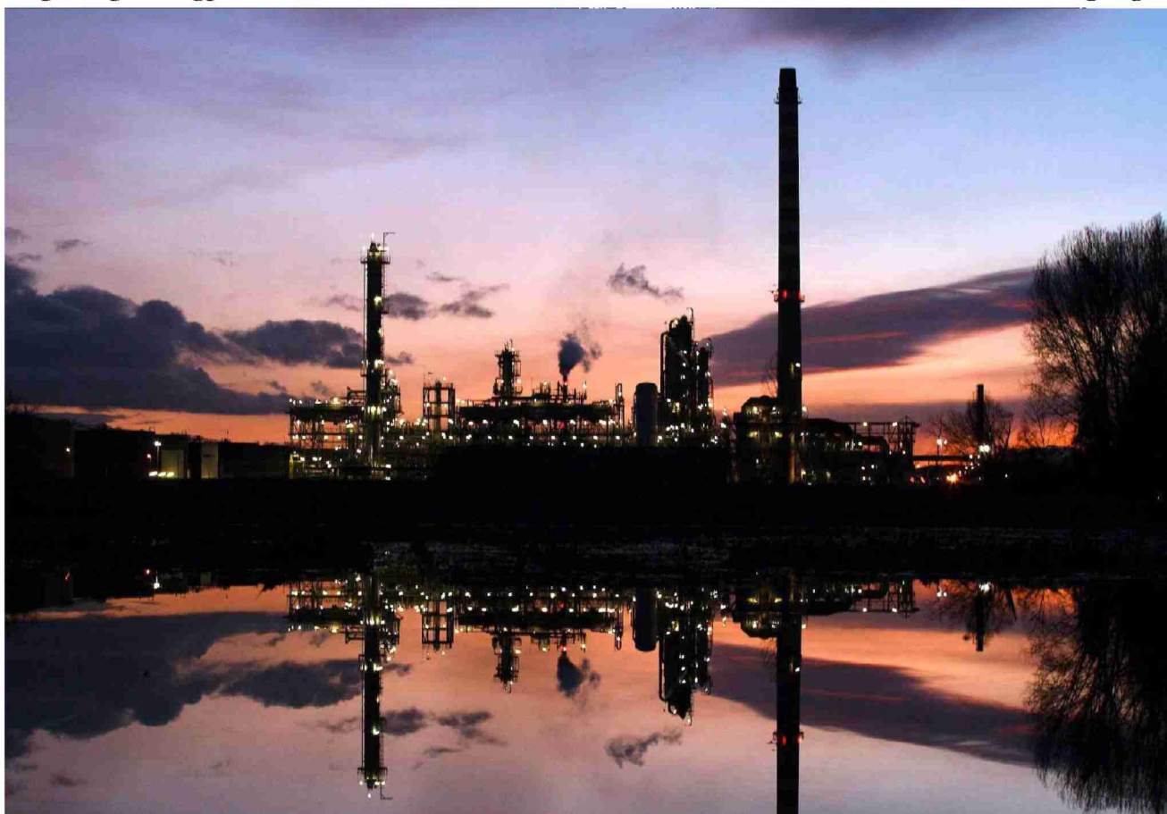
Von der Schliessung bedroht: Die Petroplus-Raffinerie im neuenburgischen Cressier.

Im schlimmsten Fall werden die zwei einzigen Raffinerien in der Schweiz 2012 stillgelegt. Das könnte langfristig zu Engpässen auf dem Brenn- und Treibstoffmarkt führen, warnt die Erdöl-Vereinigung.