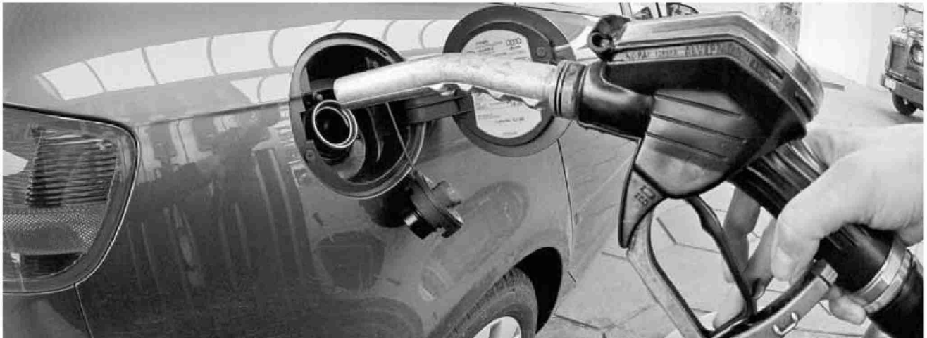
Billig abzapfen war einmal: Für ausländische Autofahrer ist das Benzin in der Schweiz aufgrund der massiven Frankenaufwertung derzeit deutlich teurer als vor vier Jahren.

Themen-Nr.: 719.10 Abo-Nr.: 1077515 Seite: 3 Fläche: 70'507 mm 2