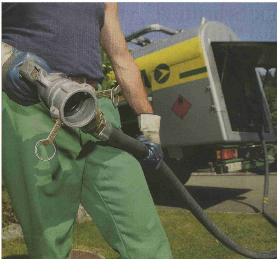
Heizöl ist in Schweizer Haushalten nach wie vor die klare Nummer 1 unter den Energieträgern.

Themen-Nr.: 719.10 Abo-Nr.: 1077515 Seite: 9 Fläche: 98'955 mm 2