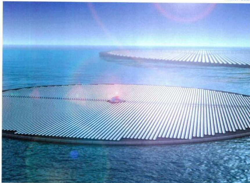
Modèle d'une île solaire pouvant approvisionner plusieurs milliers de ménages en énergie.