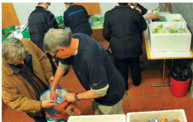
Freiwilligen Mitarbeitenden bietet das Projekt eine sinnvolle Tätigkeit.

In der Lebensmittelindustrie sparen die Produktspender durch die kostenlose Entsorgung hohe Abfall- oder Recyclinggebühren. Zudem können sie durch ihr Engagement die Unternehmensreputation positiv beeinflussen und so einen Beitrag zur Wertschöpfung leisten.