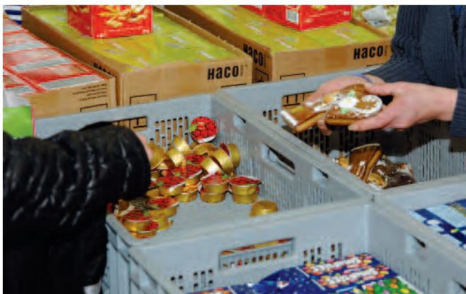
Schweizweit existieren mehr als 70 Abgabestellen.

Meistens handelt es sich dabei um Produkte, die falsch verpackt wurden, aus Überproduktion stammen oder die kurz vor dem ablaufenden Verkaufs- oder Konsumationsdatum stehen. Anstatt diese Lebensmittel zu vernichten und dafür Entsorgungsgebühren zu bezahlen, geben die Produktspende sie kostenlos an Tischlein deck dich ab.