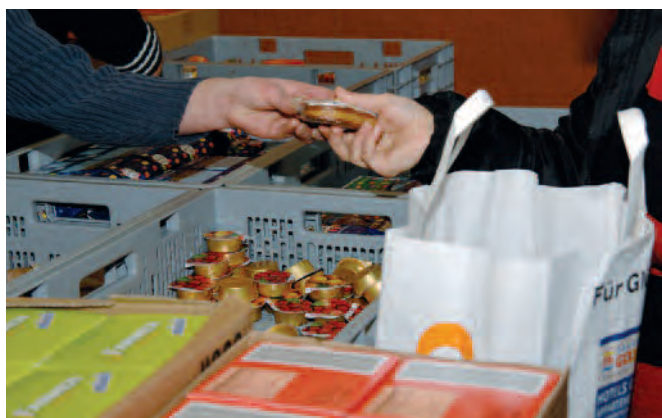
Tischlein deck dich schlägt eine Brücke zwischen Armut und Überfluss.

Weitere Informationen sind unter www.tischlein.ch verfügbar.