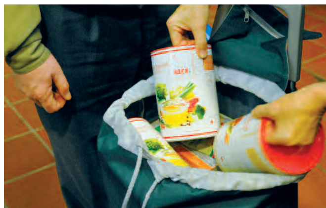
Tischlein deck dich füllt jährlich zehn Millionen Teller.