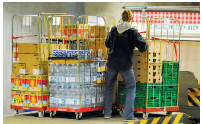
Im Lager in Winterthur werden die Produkte sortiert.

Die Lebensmittelhilfe ersetzt den wöchentlichen Einkauf nicht, ergänzt ihn aber mit Produkten, die sich armutsbetroffene Menschen nur selten leisten können – zum Beispiel frisches Gemüse, Datteln oder eine Schachtel Pralinen.